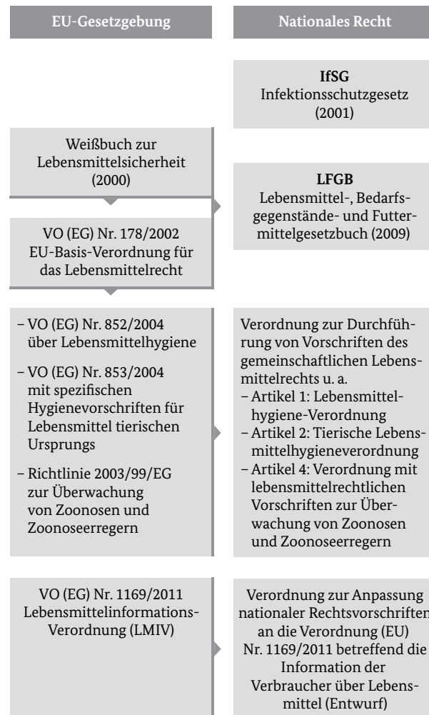
Abbildung 1: Übersicht über die rechtlichen Rahmenbedingungen in der Gemeinschaftsverpflegung

Außerdem wird die Anwendung einschlägiger DIN-Normen (zum Beispiel 10508 Temperaturen für Lebensmittel, 10526 Rückstellproben in der GV, 10524 Arbeitskleidung, 10514 Hygieneschulung) empfohlen. 42