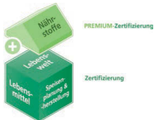
Abbildung 2: Qualitätsbereiche der Zertifizierung

Nach erfolgreich bestandenem Audit erhält der Caterer ein Zertifikat einschließlich DGE-Logo beziehungsweise DGE-PREMIUM-Logo und kann damit werben. Die Audits gelten als bestanden, wenn mindestens 60 Prozent in jedem Qualitätsbereich der Kriterien erfüllt sind.